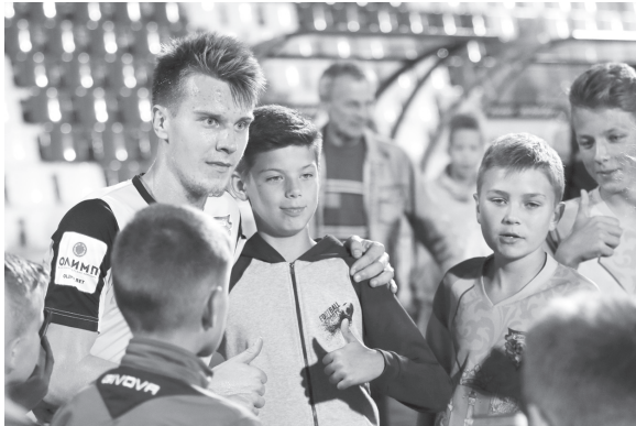
Впервые за много лет после матчей футболистов «Волги» атакуют любители автографов.

Во втором матче подряд ульяновская дружина одержала волевою победу. И если туром ранее успех в матче с «Уфой-2» был ожидаем (3:1), то виктория над одним из фаворитов чемпионата - «Нефтехимиком» - стала настоящим подарком для болельщиков ульяновского клуба.