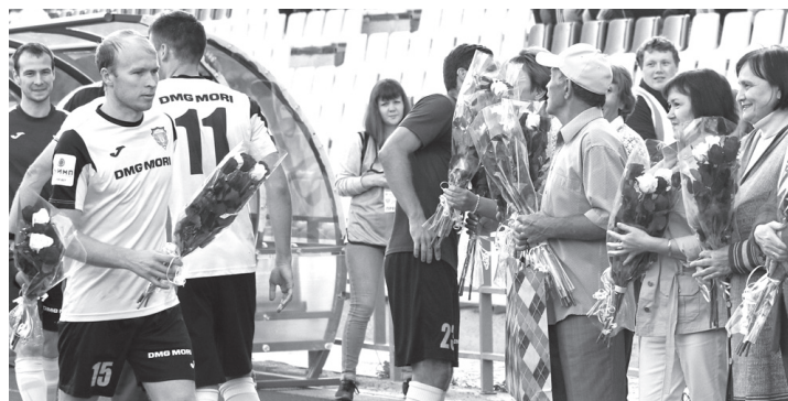
Главный подарок для учителей в День знаний - победа «Волги».

- Такие победы, как сегодня, должны стать правилом, а не исключением. Тогда и народ вернется на стадион. Простой рецепт... Поймали после игры себя на мысли, что мы не обыгрывали фаворитов чемпионата уже почти пять лет, тогда, 24 сентября 2013 года, победили «Тюмень»... Боритесь, ребята. Бейтесь за победу в каждом матче!